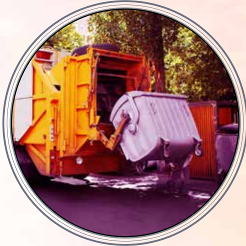
إدارة المخلفات Waste Management